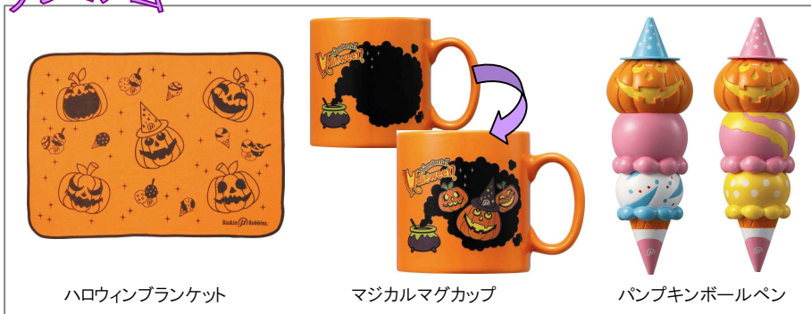
ハロウィンブランケット