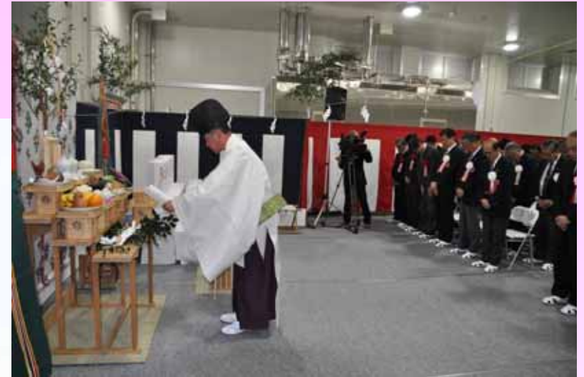
竣工式の様子 2014年12月5日